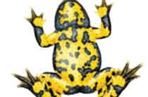
Gelbbauchunke ( Bombina variegata )