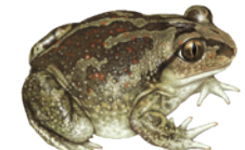
Knoblauchkröte ( Pelobates fuscus )