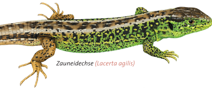
Zauneidechse ( Lacerta agilis )

Welche dieser streng geschützten Arten Sie in Ihrem Garten finden können, hängt also vom Strukturreichtum ab, aber auch von den Vorkommen in der unmittelbaren Umgebung. Wenn beides vorhanden ist, kommen die Tiere von selbst.