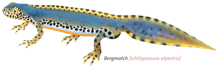
Bergmolch ( Ichthyosaura alpestris )