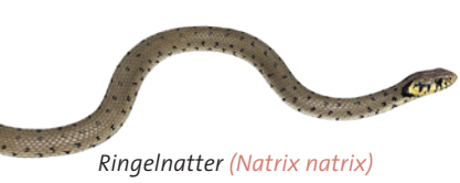
Ringelnatter ( Natrix natrix )