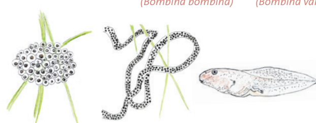
v.l.n.r.: Froschlaich, Krötenlaich, Kaulquappe