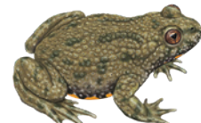
Unken ( Bombina spp. )