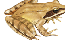
Springfrosch ( Rana dalmatina )