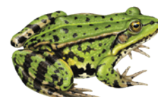
Wasserfrösche ( Pelophylax spp. )