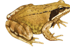
Grasfrosch ( Rana temporaria )