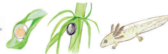
v.l.n.r.: Molcheier, Molchlarve