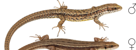
Bergidechse ( Zootoca vivipara )