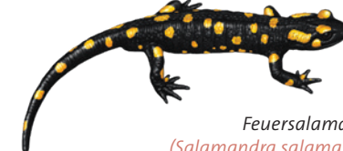
Feuersalamander ( Salamandra salamandra )