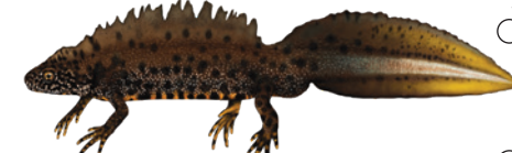
Kammolche ( Triturus spp. )