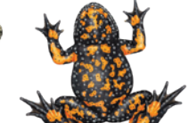
Rotbauchunke ( Bombina bombina )