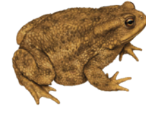
Erdkröte ( Bufo bufo )