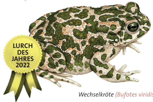
Wechselkröte ( Bufo viridis )